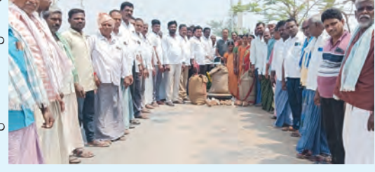
పరిధాన్యం కొనుగోలు కేంద్రాన్ని ప్రారంభించిన ధ్యేయం