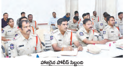
హాజరైన పోలీస్ సిబ్బంది