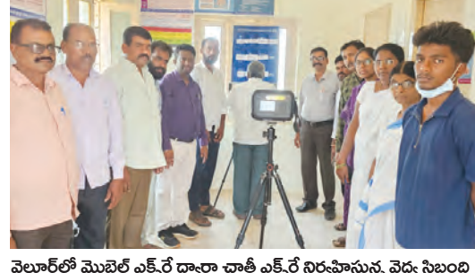
వెల్లూరులో మొబైల్ ఐక్వీర్ డ్యూరా ఛాక్ అక్వీర్ నిర్వహిస్తున్న వైద్య శిబిరం